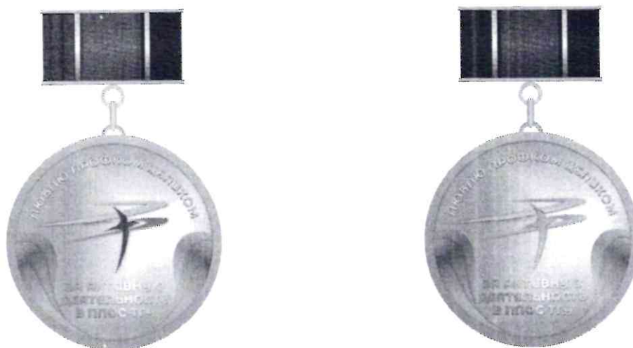
Эскиз нагрудного знака «За активную деятельность в ППОС ТГУ»

В нижней части правой стороны удостоверения размещается оттиск печати ППОС ТГУ.