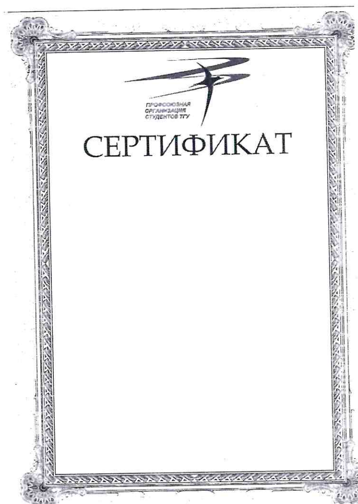
Шаблон Сертификата ППОС ТГУ

2. Решение о награждении Сертификатом принимают Председатели профбюро факультетов/институтов/школ, Руководители комиссий ППОС ТГУ, сотрудники ППОС ТГУ.