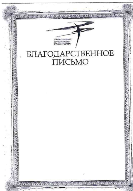
Шаблон Благодарственного письма ППОС ТГУ

3. Решение о награждении благодарственным письмом принимают Председатели профбюро факультетов/институтов/школ, Руководители комиссий ППОС ТГУ, сотрудники ППОС ТГУ.